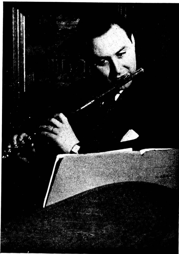
Jean - Pierre RAMPAL

La page de couverture est la reproduction d'un émail (1951) du Maître Bigard