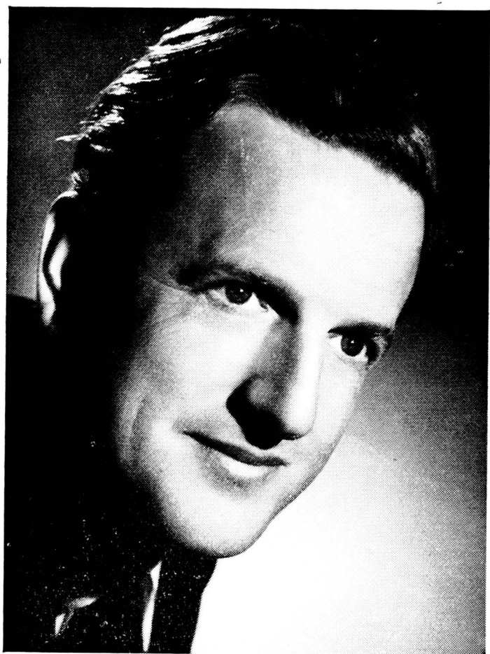
PETER PEARS TÉNOR