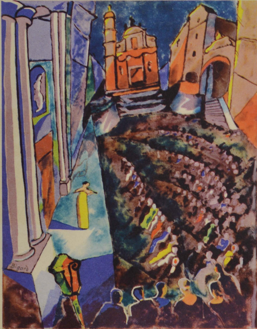
Photogravure X RICHARD